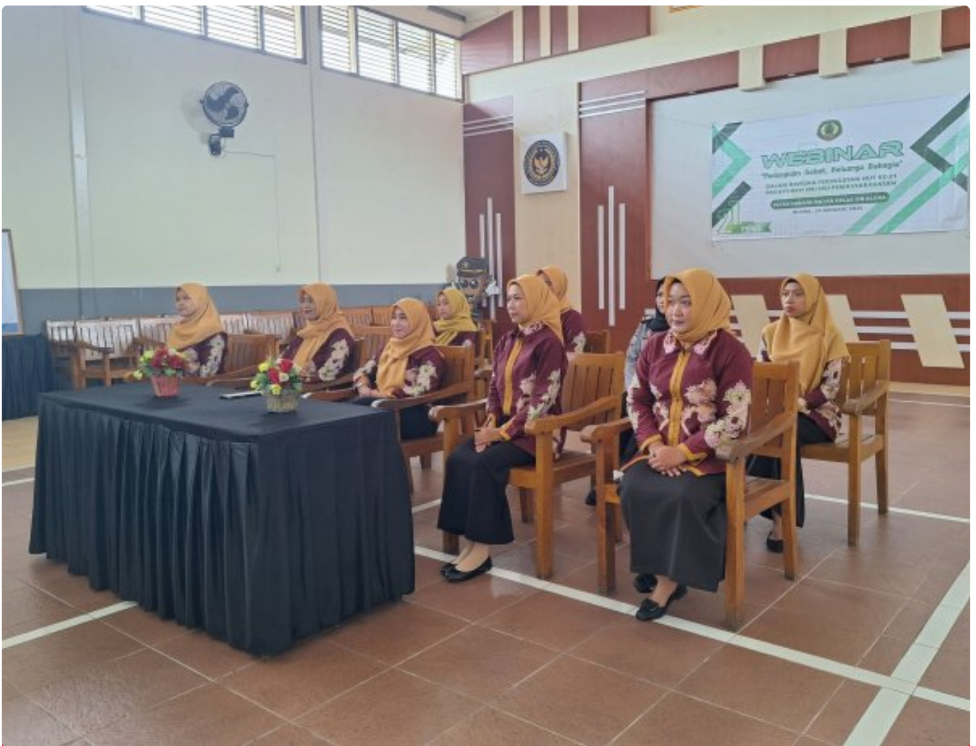
Peringati HUT ke-21, PIPAS Rutan Blora Ikuti Webinar "Perempuan Sehat, Keluarga Bahagia"